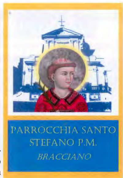
PARROCCHIA SANTO STEFANO P.M. BRACCIANO