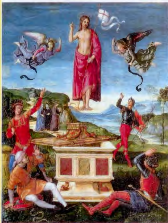
Raffello Sartzio Resurrezione 1501

Siamo allora chiamati in questa solennità di Pasqua a riscoprire l'importanza della partecipazione ai riti, alle celebrazioni e alle liturgie per esprimere, arricchire, educare la nostra fede. Così la Pasqua diviene "dono da accogliere sempre più profondamente nella fede, per poter operare in ogni situazione, con la grazia di Cristo, secondo la logica di Dio, la logica dell'amore. La luce della risurrezione di Cristo deve penetrare questo nostro mondo, deve giungere come messaggio di verità e di vita a tutti gli uomini attraverso la nostra testimonianza quotidiana" . (Benedetto XVI – 27/04/2011).